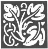
TABLE OF CONTENTS