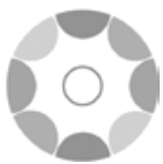
Drum Circle Musik

Die folgenden Symbole kennzeichnen die verschiedenen Informationskategorien. Mit ihrer Hilfe kannst du die benötigten Informationen rasch finden.