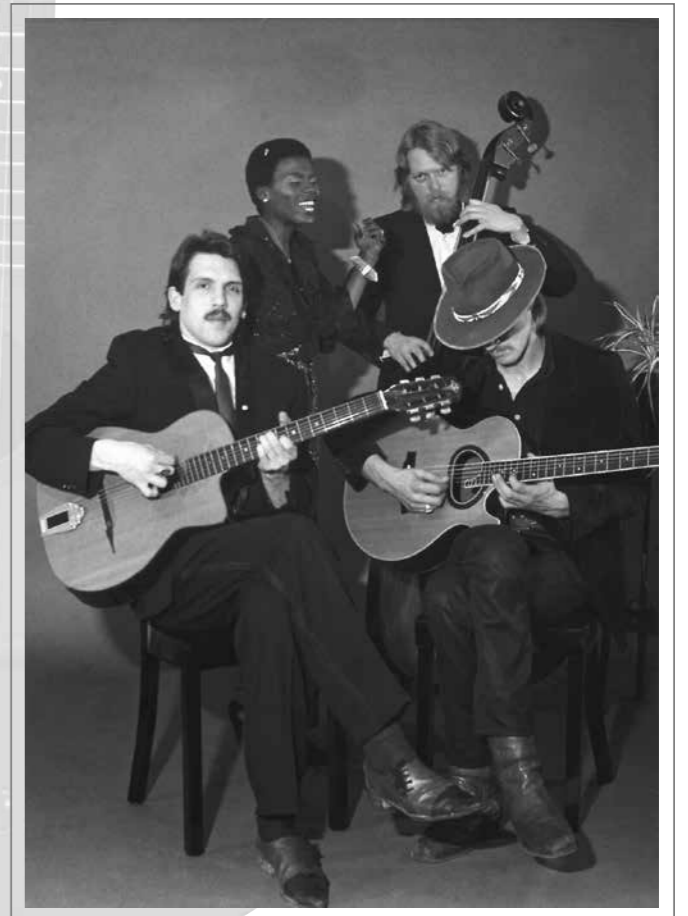
„Alex Rodmann Group“, 1983

Vielleicht muss ich dazu vorausschicken, dass ich als Autodidakt mein Instrument schon immer so gelernt hatte: durch reines Anhören von Schallplatten eine Melodie, einen Akkord oder Tonfolgen herauszuhören.